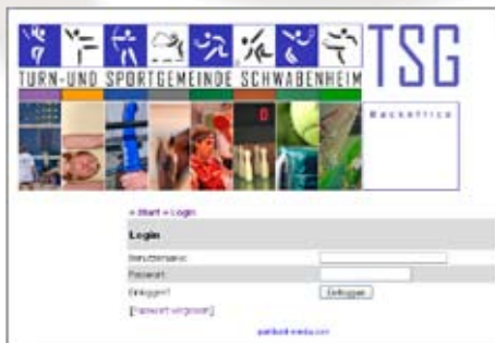
Das Backoffice-Redaktionssystem der TSG Schwabenheim-Webseite.

Was haben wir noch vor? Wohin wollen wir noch?